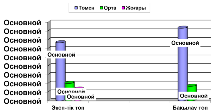
2-сурет - Бақылау сауалнамасының диаграммасы

ты палуандарымыздың өмірі мен спорттық жетістіктері негізінде тәрбие берудегі рөлі туралы білімдерінің көрсеткіштеріне саралау жасар болсақ: төмен деңгей 66,6 пайыз, орта деңгей 20 пайыз, жоғары деңгей 13,4 пайыз болса; бақылау тобындағы көрсеткіші: төмен деңгей 83,3 пайыз, орта деңгей 16,7 пайыз, жоғары деңгейде білетіндер жок (2-сурет).