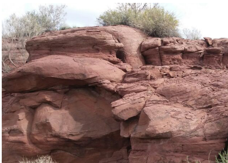
5-сурет – Қатутау таулары

Шығыс және батыс бөлігінде екі палеовулкан орналасқан. Олардың андезиттік құрамдағы бомбалық хаотикалық туфтармен толтырылған классикалық жеткізгіш саңылаулары бар деп болжанауда. Таулар оңтүстік-батыстан солтүстік-шығысқа қарай үстірт тәрізді шыңдары бар таулы жоталар түрінде созылды. Беткейлер сусыз шатқалдардың көптігімен шектелген. Ашық жолақтарда көгілдір әктас құмтастары мен қызыл саздар бар. «Қатутау» сөзі «қатал таулар» дегенді білдіреді. Пермь дәуірінде дәл осы жерде екі жанартау болған деп есептеледі. Шынында да, таулар тек лавадан және басқа жанартау жыныстарынан тұрады [7].