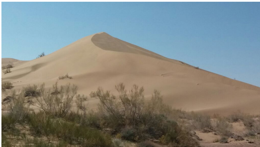
3-сурет – Айғайқұм

«Әнші құмның» бір ерекшелігі – оның құрғақшылық кезінде әуезді дыбыстар шығару қабілеті. Бұл әуен бірнеше шақырым қашықтықта естіледі. Кішкентай құм түйіршіктері желдің әсерінен бір-біріне үйкелгенде, олар музыкаға ұқсас дыбыстар шығарады деп саналады. Жеңіл жел тыныш сыбдыр жасайды ал қатты желден құмдар ұша бастайды. Тіпті тыныш ауа райында сіз «Әнші құмның» музыкасын естисіз.