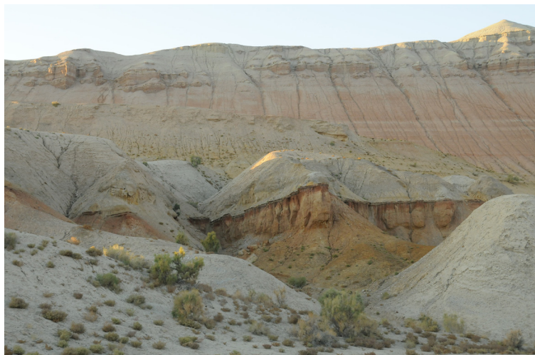
4-сурет – Ақтау таулары

Ақтау таулары өздерінің сүйектерінің пішінімен және түрлі – түсті саздармен-қызыл, қоңыр, көк және ақ түстермен таң қалдырады. Таулар жылдың кез келген уақытында және ауа-райында өте фотогенді, ауа-райы ашық немесе бұлтты болсын. Ақтау тауларының ландшафты бөтен – Марс пейзажына ұқсайды.