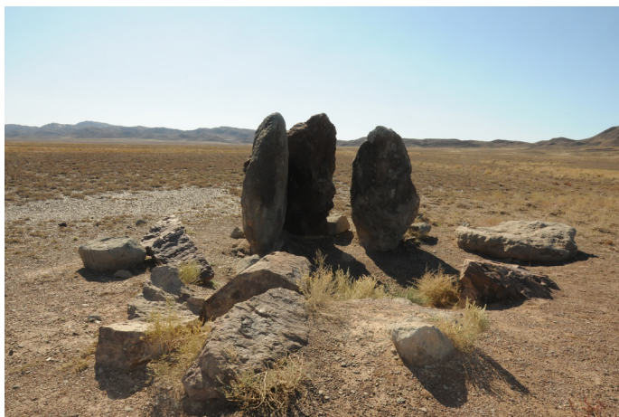
1-сурет – Қоңтажының қазан асқан ошағы

Ошақтас бабаларымыздан қалған осындай асыл мұраның бірі «Қоңтажының қазан асқан ошағы» деп те аталады. Аңызда бір қатарға қойылған үш биік тас туралы көптеген әңгімелер бар. Ата-бабасына жүгінер болсақ, сақ дәуірінде қол алысып, қол алысқан Үш батыр атанған (1-сурет).